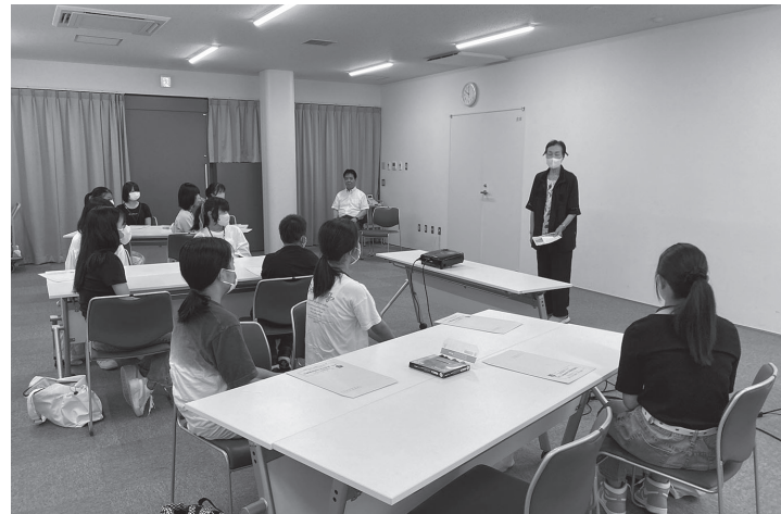
福祉についての基礎学習を受けてから、現場体験をしました。施設・事業所のみなさま、ご協力ありがとうございました。

福祉に関する理解や関心を深め、福祉の仕事への興味を持っていただくことを目的に、7月29日から7月31日までの期間中、市内在住の中高生16名が福祉施設や事業所の現場で、福祉の仕事を経験しました。