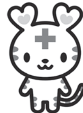
日赤マスコットキャラクター ハートラちゃん

令和3年9月13日現在 これらの義援金・救援金を 受け付けております ご協力をお願いいたします