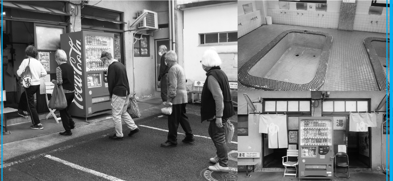
桜木デイサービスセンター

桜木デイサービスでは、9月1日より、隣接している岡湯での入浴を始めました。 広い浴槽の温泉に入り、心も体もポッカポカになり、利用する皆さんはとっても喜んで おります。